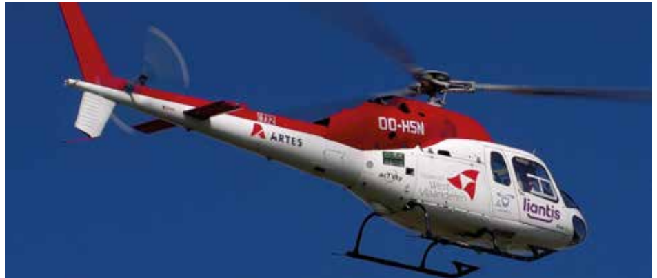
▲ Hou deze levensreddende helikopter in de lucht!